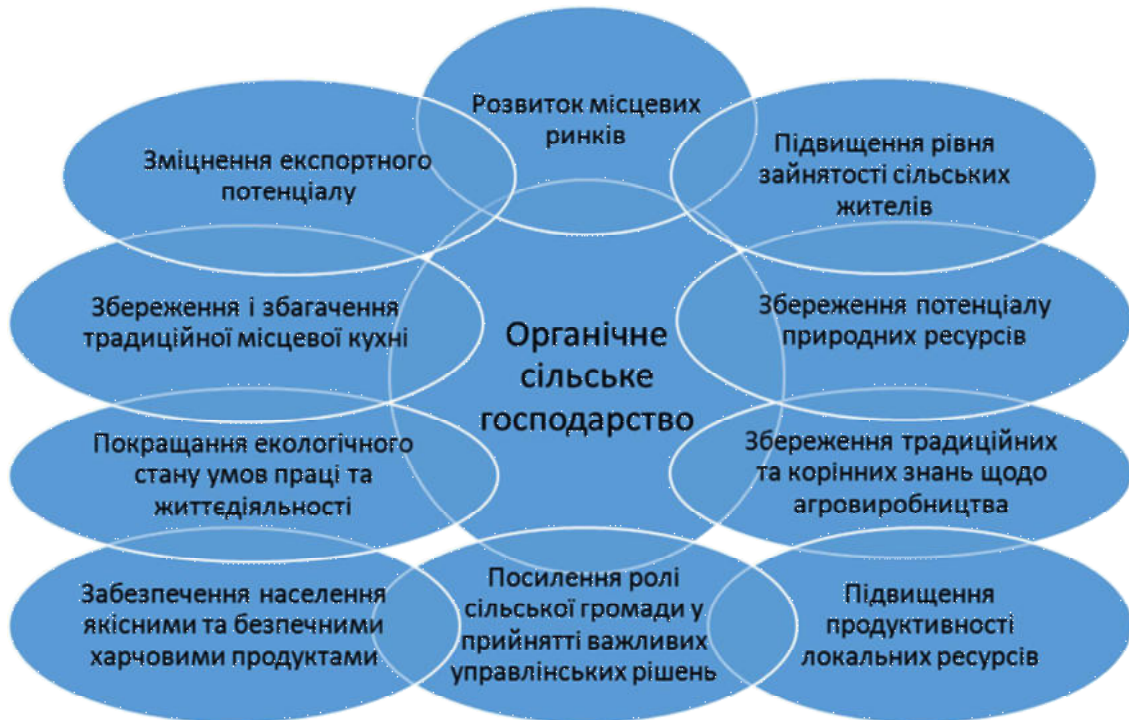
Рис. 4. Органічне сільське господарство в системі розвитку сільських територій.

- у перехідний період від конвенційного до органічного сільського господарства необхідна конкретна форма економічного стимулювання (на національному та регіональному рівнях) для вітчизняних фермерів;