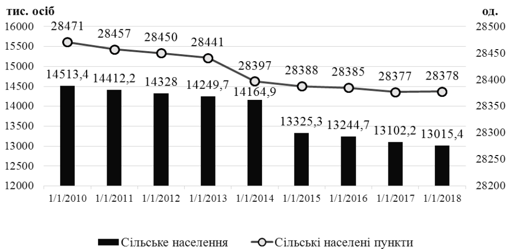
Рис. 1. Динаміка кількості сільського населення та сільських населених пунктів України.

Особливої уваги заслуговують питання погіршення екологічної ситуації у сільській місцевості. Основними причинами цього є: відсутність прогресивних технологій агровиробництва; недотримання науково обґрунтованих сівозмін із переважанням монокультур (передусім соняшнику, кукурудзи, ріпаку) у багатьох підприємствах, особливо агрохолдингах; низькі норми внесення органічних добрив; надмірне використання синтетичних засобів захисту рослин та мінеральних добрив; відсутність технологій боротьби з ерозійними процесами, закисленням, засоленням і техногенним забрудненням земель.