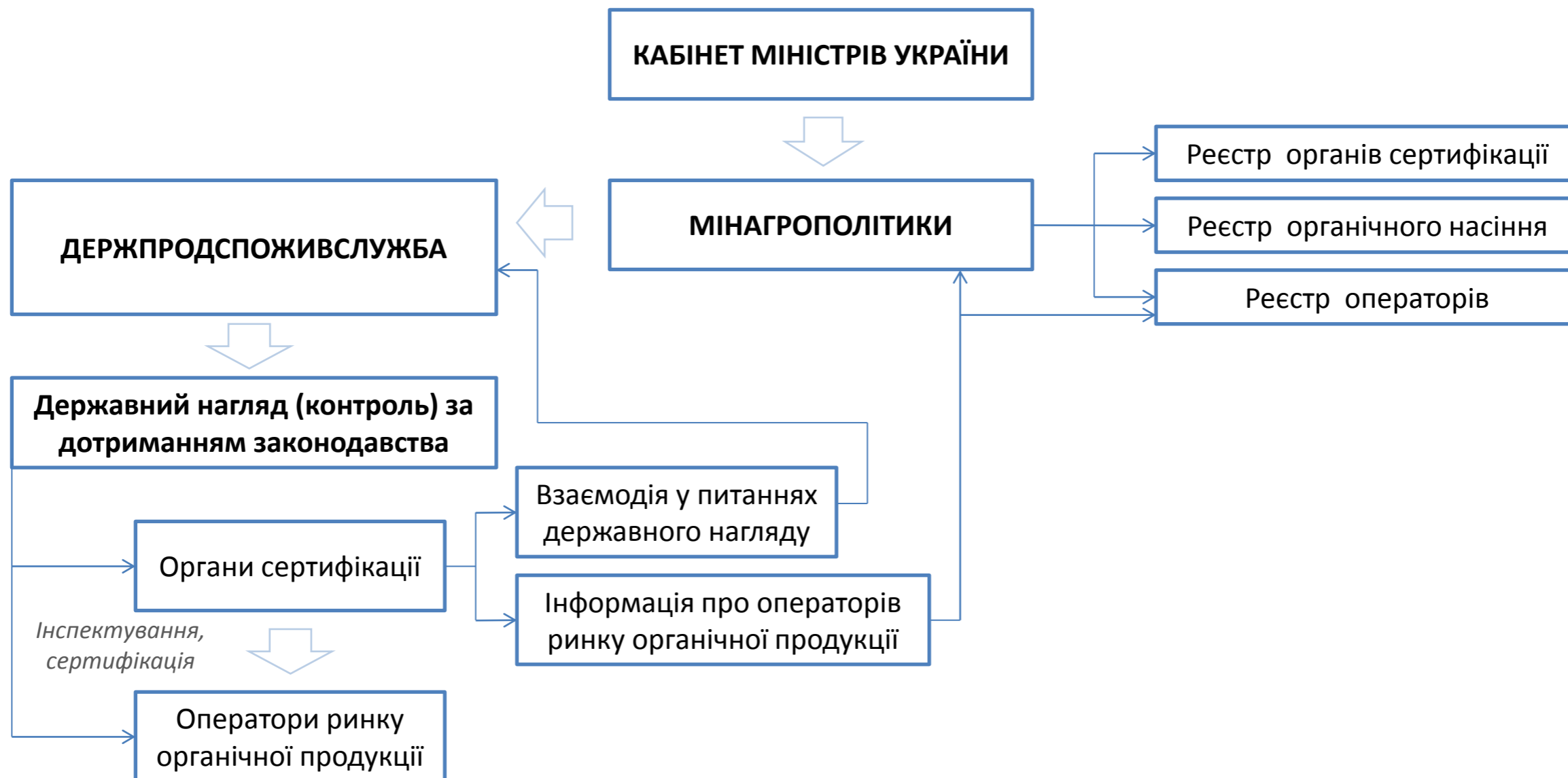
Схема здійснення державного нагляду (контролю) ( проект Закону 5448 )