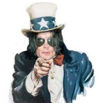
А ТИ ЗНАЄШІ, ЩО ТАКЕ ORGANIC ?

товаришем — David Gest, Майка (відомий любитель фаст-фуду) переконував, що для того, щоб курка була органічною, достатньо лиш здерти з неї шкіру. Співак, на жаль, в чергове підтверджує істину, що поширення достовірної, точної інформації серед споживачів є однією з основних задач учасників органічного руху.