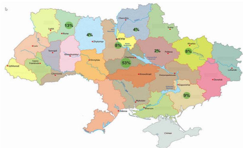
Рис. 3. Розподіл обсягу виробництва органічних круп по областях країни у 2017 році

Географія обсягу виробництва найбільших вітчизняних виробників органічних круп розроблена за даними [13,11] та наведена на рис. 3. Серед них варто виділити такі: ТОВ «Фірма «Діамант ЛТД», ТОВ «Органік оригінал», ТОВ «Органік лайф», ПП «Агроекологія», ТОВ «Кварк», ТОВ «Цефей-Групп», ТОВ «Агрофірма «Поле», ТОВ «Адоніс Люкс», ПП «Галекс-Агро», ТОВ «Дедденс Агро», ТОВ «Сквирський комбінат хлібопродуктів». У сумі вони виробляють левову частку органічних круп в Україні.